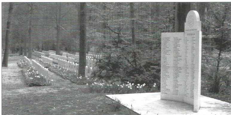
Het stenen drieliuk op het Nederlandse Ereveld in Frankfurt am Main, met de namen van 242 slachtoffers die hier niet konden worden begraven.