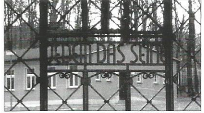
Links: Toegangspoort tot het kamp Buchenwald. Hierboven de cynische tekst op de poort: JEDEM DAS SEINE [IEDER HET ZIJNE].