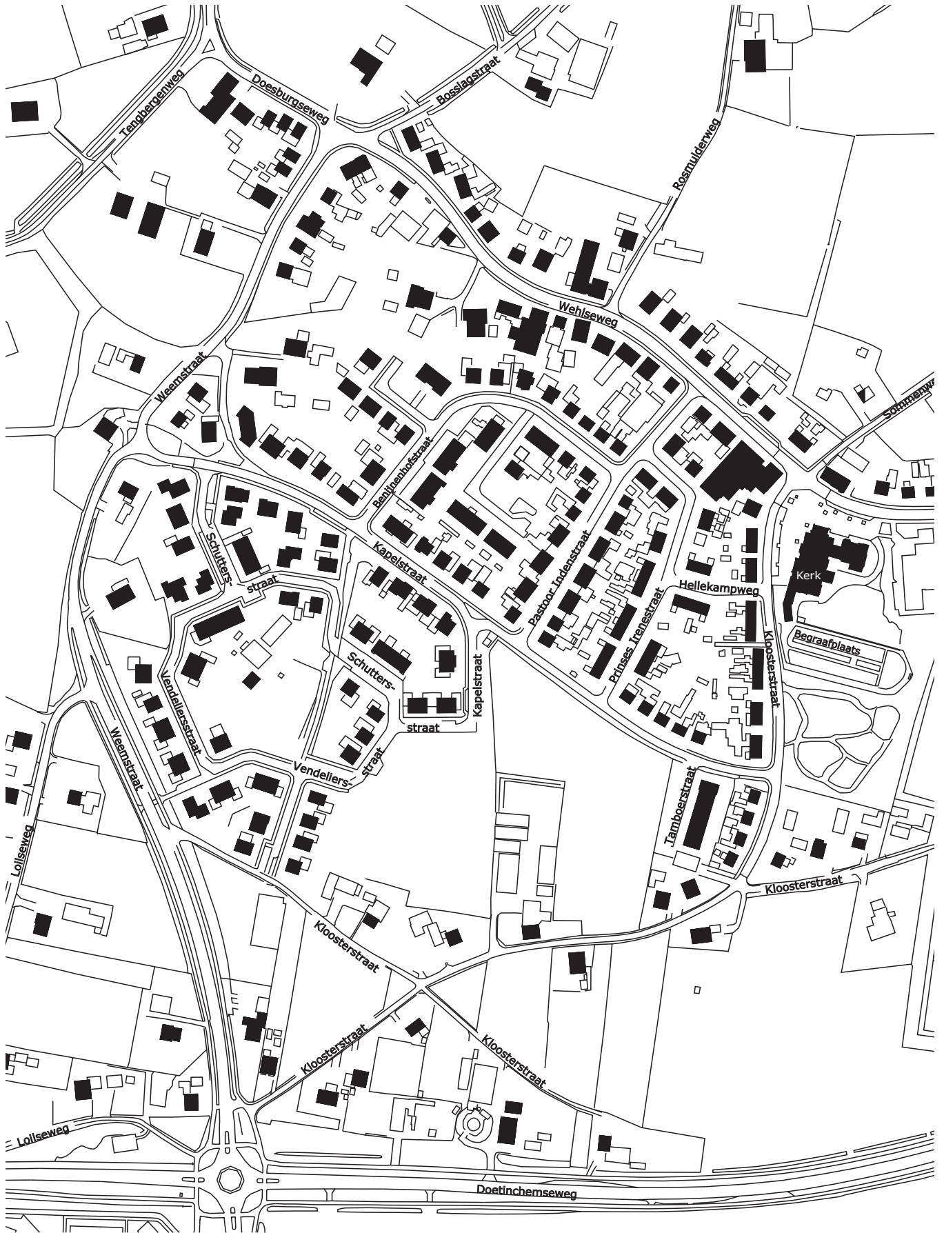
6.2. De Loilse dorpskern.